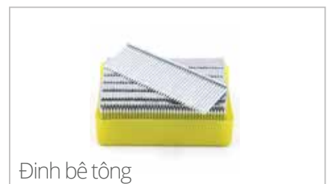
Đinh bê tông