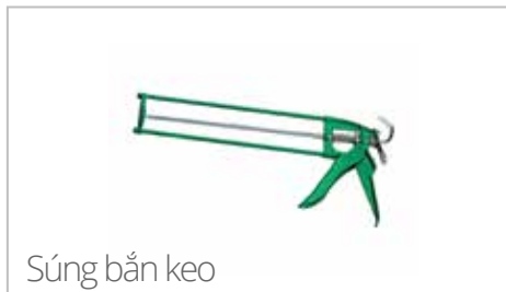
Súng bắn keo