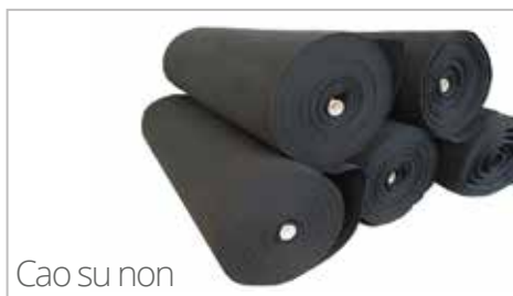
Cao su non