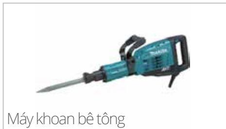
Máy khoan bê tông