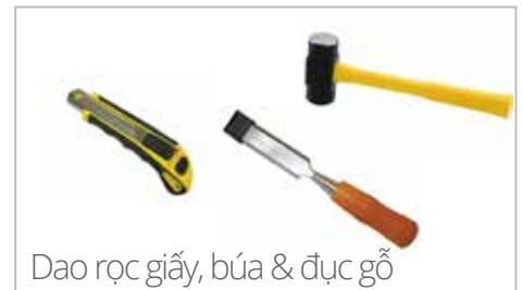
Dao rọc giấy, búa & đục gỗ