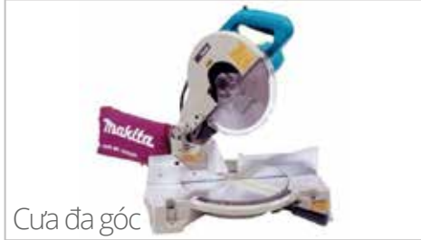
Cưa đa góc